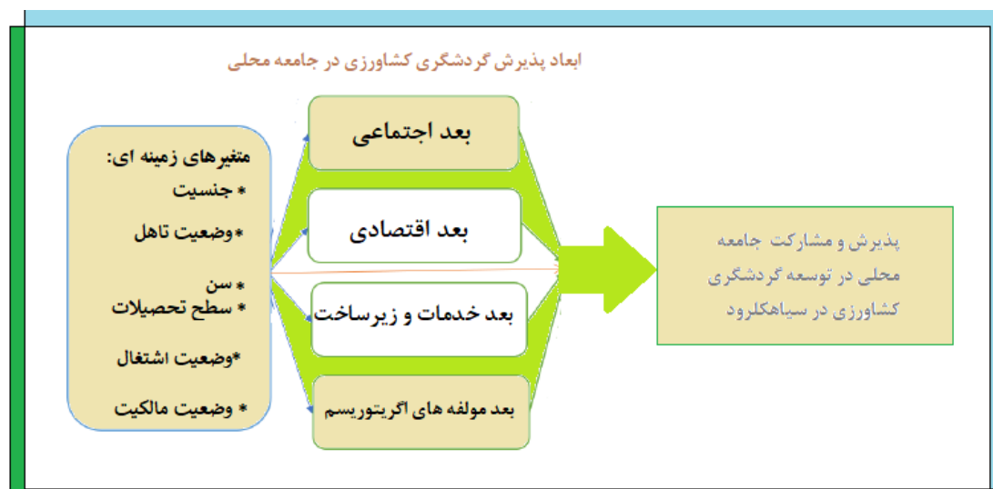
شکل ۱. شاخص های پژوهش

شفریل ۱ و همکاران (۲۰۱۴)، در پژوهشی با موضوع درک جامعه ساحلی از تأثیرات اجتماعی-اقتصادی فعالیت های آگروتوریسم در روستاهای ساحلی مالزی: به بررسی تأثیرات اجتماعی-اقتصادی فعالیت های آگروتوریسم در روستاهای ساحلی نمونه به عنوان دهکده چشم انداز ماهیگیری (DWN) در مالزی می پردازد. با این حال، تمرکز این مطالعات اخیر بیشتر بر گردشگران و چالش های انجام فعالیت های آگروتوریسم بوده است و در نتیجه به تأثیرات اجتماعی و اقتصادی توجه کمتری شده است. در مجموع و براساس چهارچوب نظری پژوهش مشخص شد که متغیرهای زمینه ای و ابعاد موثر بر توسعه گردشگری کشاورزی به شرح شکل ۱ می باشند.