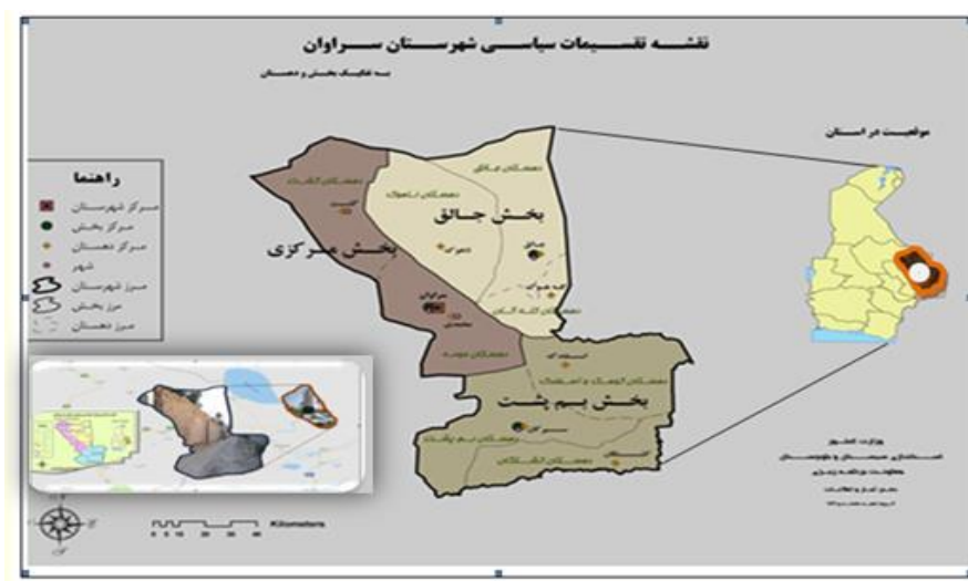
شکل ۱. نقشه موقعیت جغرافیایی محدوده مورد مطالعه

شهر سراوان ۲۳۸۸۰ کیلومتر مربع وسعت دارد. مساحت این شهرستان ۱۵/۲ درصد مساحت کل استان را تشکیل می‌دهد و در موقعیت ۶۲ و ۳۵ دقیقه عرض جغرافیایی واقع شده است. از شمال غرب به خاش، از غرب به سوران، از شرق و جنوب شرقی به کشور پاکستان و قسمتی از جنوب به شهرستان سرباز محدود می‌شود. براساس سرشماری در سال ۱۳۹۵ جمعیت این شهر ۱۹۱ هزار و ۶۶۱ نفر شامل ۹۶ هزار و ۵۸۹ نفر مرد و ۹۵ هزار و ۷۲ نفر زن بوده است. آب شرب این شهرستان از طریق ۱۲۶۹ حلقه چاه ۳۰۷ رشته قنات ۲۷۲ رشته چشمه با میزان آبدی ۱۸۳ میلیون مترمکعب و رودخانه‌های ماشکید با میزان آبدی متوسط سالانه ۸۰ میلیون مترمکعب تأمین می‌شود. شهر سراوان دارای اقلیم بیابانی گرم و خشک می‌باشد. میانگین بارش سالانه در این شهرستان ۱۰۴/۶ میلی‌متر و متوسط دمای آن از ۴۳ الی ۴- درجه‌ی سانتی‌گراد در تغییر است. مردم شهر سراوان به زبان بلوچی تکلم می‌کنند و زبان فارسی نیز رایج است. میزان باسوادی شهرستان در سال ۸۲، ۶۹/۱ درصد بوده است.