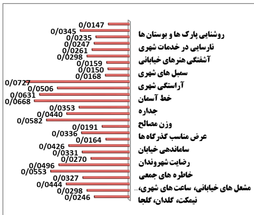
شکل ۳. اولویت بندی نهایی شاخص های تحقیق