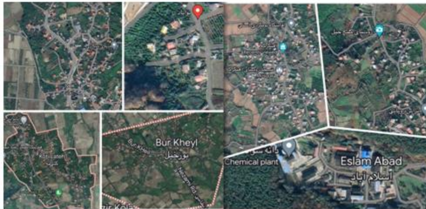
شکل ۲. محدوده مورد مطالعه در تقسیمات استان مازندران