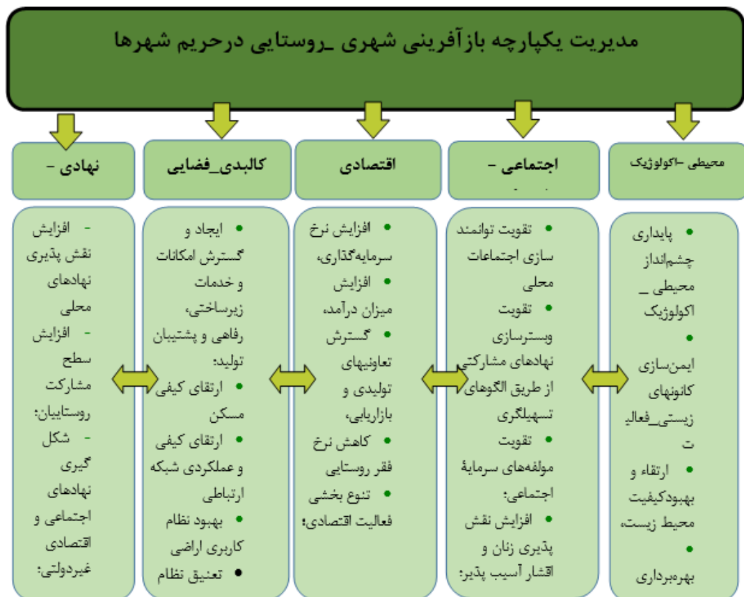
شکل ۴. سیاست کلان مدیریت روستاهای حریم شهرها مبتنی بر برنامه ریزی فضایی - راهبردی